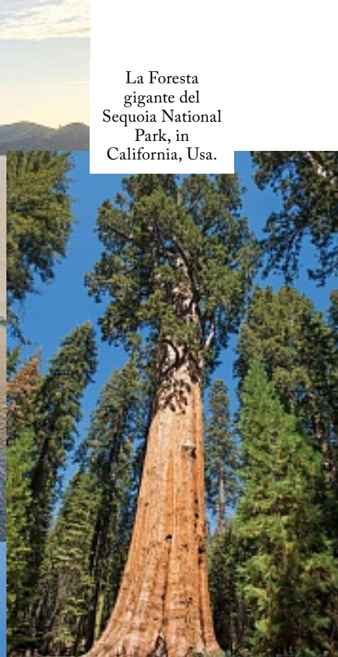
La Foresta gigante del Sequoia National Park, in California, Usa.

Palme e lunghi arenili bianchi, lo scenario perfetto per scambiarsi parole dolci in completo relax