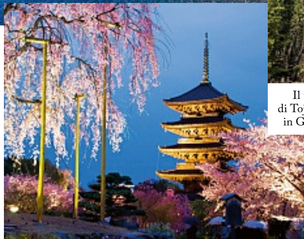
Il tempio di Toji a Kyoto, in Giappone.

In quella stessa parte del globo si trovano le isole Fiji ( fiji.com.fj ), vero santuario marino tropicale, tra le new entry