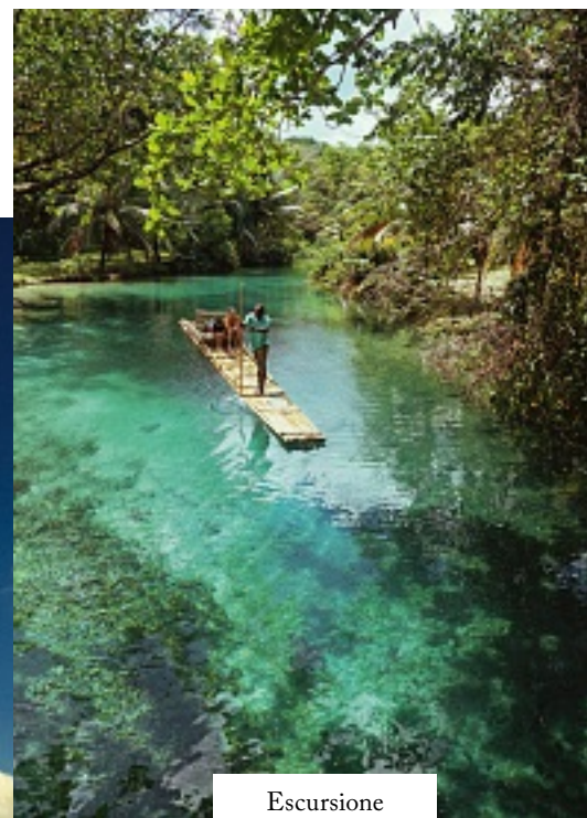
Escursione lungo un fiume, in Giamaica.