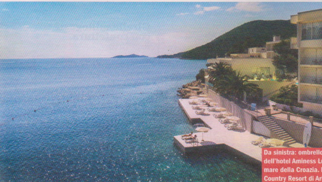
Da sinistra: ombrelloni e lettini dell'hotel Aminess Lume, sul mare della Croazia. L'hotel Horse Country Resort di Arborea (Or) organizza passeggiate a cavallo.