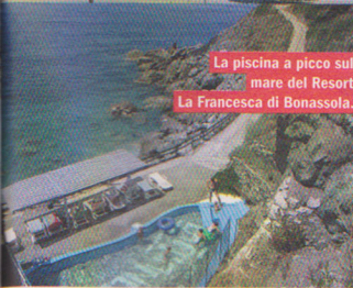
La piscina a picco sul mare del Resort La Francesca di Bonassola.