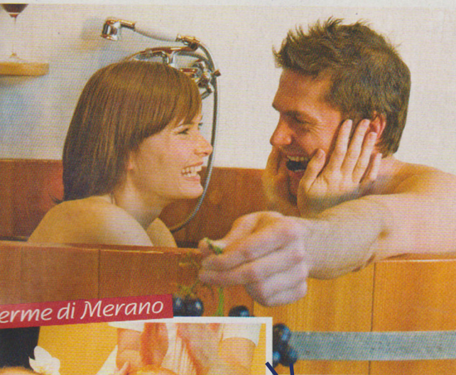
erme di Merano