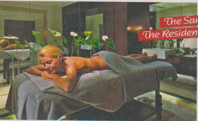
The Sanctuary The Residence Mauritius

Passando dalla sauna al bagno turco, dalla piscina riscaldata con idromassaggio alla doccia emozionale, dalla fontana di ghiaccio alla zona relax con i lettini ad acqua, il percorso benessere della Spa regala un'intensa esperienza sensoriale, per una remise en forme all'insegna della dolcezza. Sono infine disponibili trattamenti viso, corpo e viso-corpo e vari massaggi, compresi quello riservati alle future mamme, agli sportivi e quelli con l'uso di pietre calde.