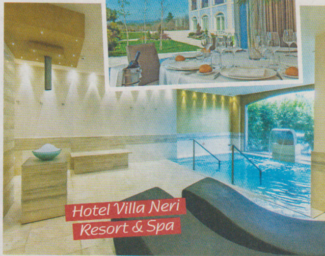
Hotel Villa Neri Resort & Spa

Alle pendici dell'Etna c'è un luogo dove i prodotti di questa terra si trasformano in ingredienti magici usati per rigenerare sia il fisico, sia la mente. Si tratta dell' Hotel Villa Neri Resort & Spa ( www.hotelvillaneri.it ) di Linguaglossa, in provincia di Catania. All'interno di questa struttura, infatti, sorge Petra Spa, dove trovano ampio uso estratti di piante locali, olio d'oliva, sale marino, mosti d'uva dell'Etna, spezie e agrumi.